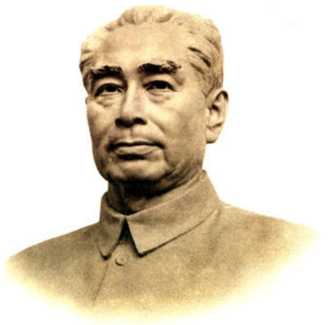
Traf 1956 den Dalai Lama: Chinas Premierminister Zhou Enlai

Trotzdem bleibt die Verwirklichung des Kommunismus eines der bedeutendsten menschlichen Experimente, und ich leugne nicht, dass ich anfangs sehr von seiner Ideologie beeindruckt war. Wie ich aber bald herausfand, bestand das Problem darin, dass der Kommunismus zwar vorgibt, »dem Volk« zu dienen - für