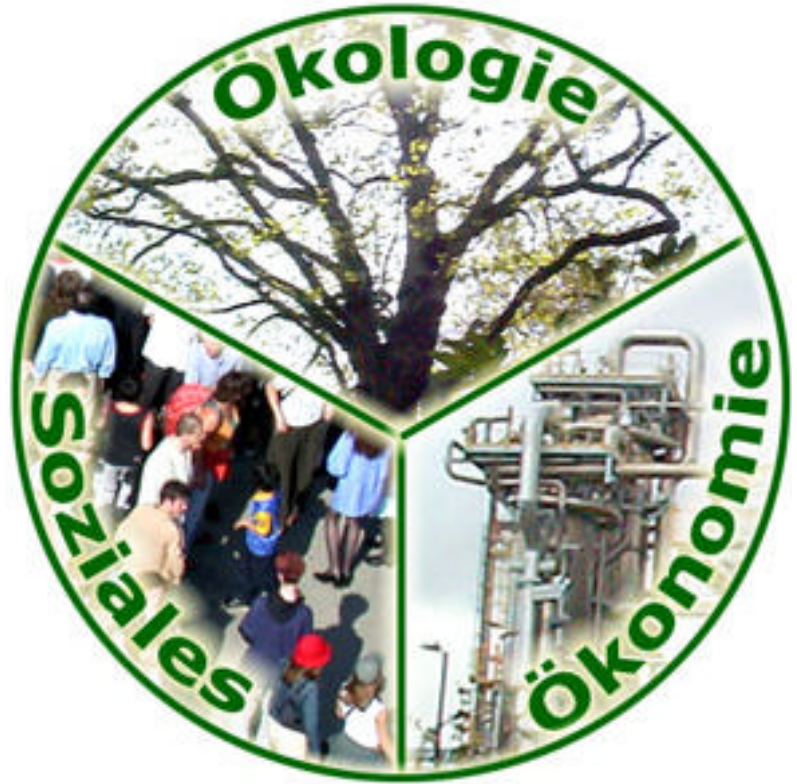
Der Dalai Lama vertritt das Konzept der Nachhaltigkeit

ich wohl noch immer ein halber Sozialist. Ich habe nichts gegen den Kapitalismus, solange er in einer menschlichen Weise praktiziert wird. Aufgrund meiner religiösen Vorstellungen tendiere ich jedoch in Richtung Sozialismus und Internationalismus, die sich eher mit den buddhistischen Prinzipien vereinbaren lassen. Was mir auch am