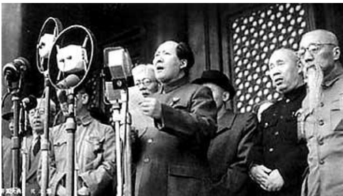
1949: Mao Zedong proklamiert die Volksrepublik China